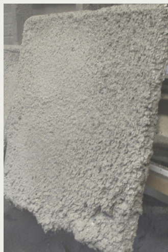
Figur 2. Sprutade provplatta utan hydrofoberingsmedel.

När det gäller påverkan på den vattenavvisande förmågan mätt som absorptivitet så var den positiva effekten i sprutbetong inte lika stor som i de gjutna bruksproverna, men ändå klart märkbar. Se figur 4. Kloridmigrationskoefficienten minskade också med cirka 40 % vid tillsats av hydrofoberingsmedel.