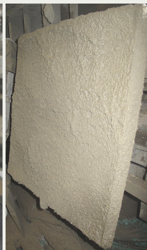
Figur 3. Sprutade provplatta med hydrofoberingsmedel.